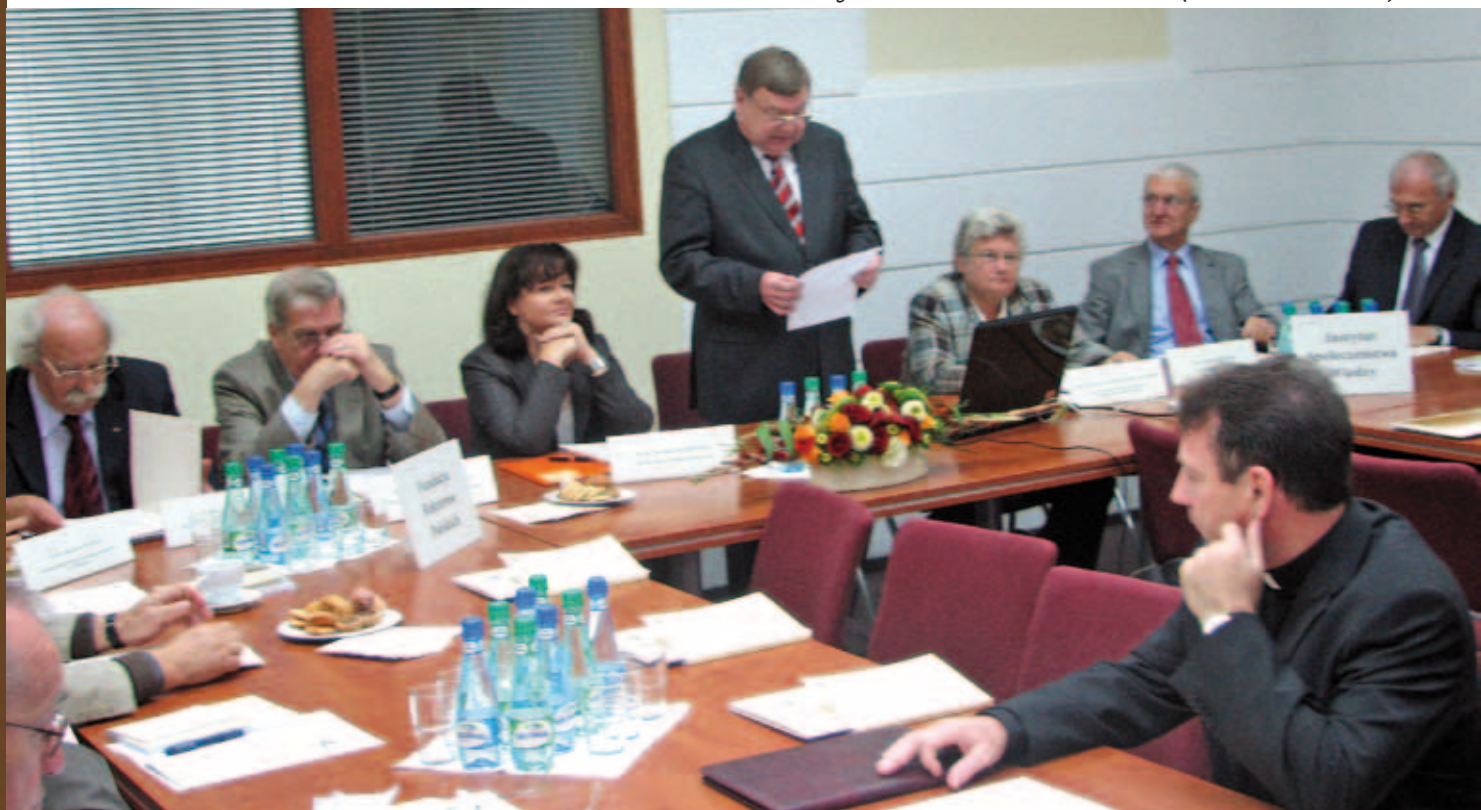
Zgromadzenie Fundatorów FRP i ISW (17 września 2008 r.)