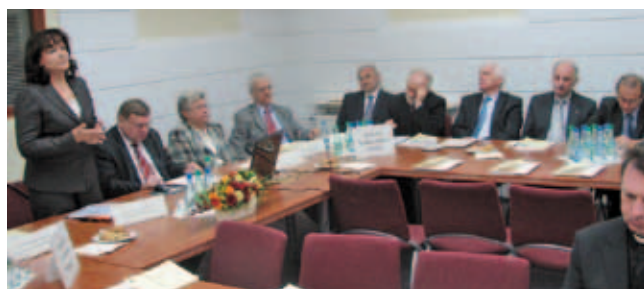
Zgromadzenie Fundatorów FRP i ISW (17 września 2008 r.)