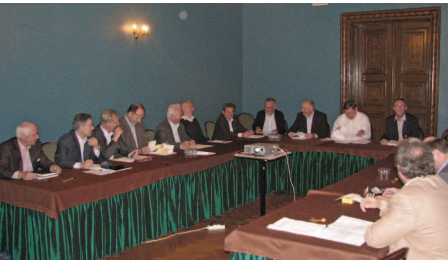
Poseidzenie wyjazdowe KOiL (8 maja 2009 r.)