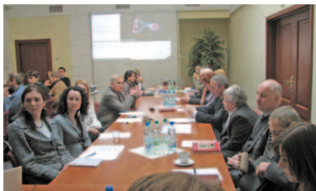
Seminarium „Rola szkolnictwa wyższego w kształtowaniu społeczeństwa wiedzy” (1 czerwca 2009 r.)