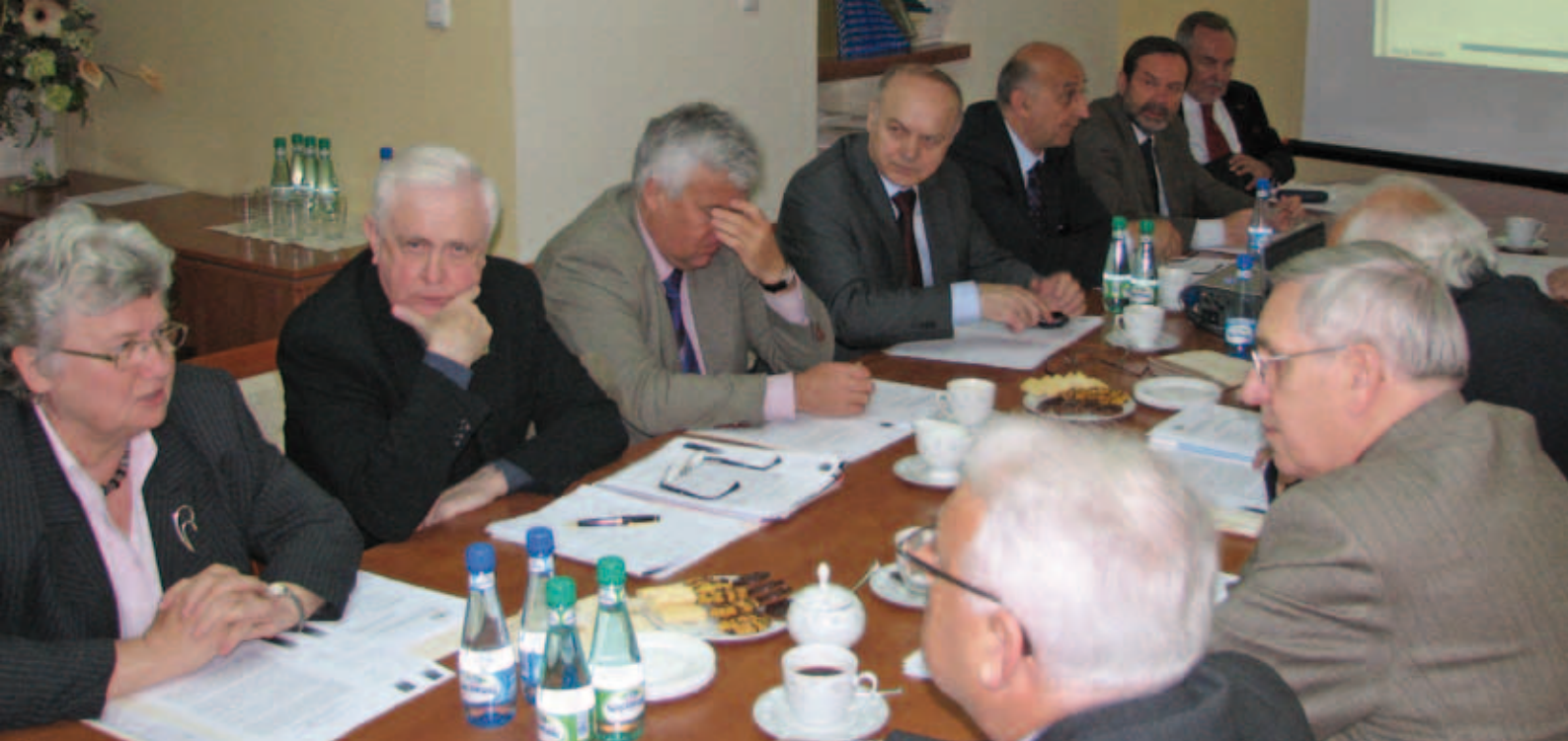
Posiedzenie Komitetu Sterującego projektu „Strategia rozwoju szkolnictwa wyższego w Polsce 2010-2020” (20 kwietnia 2009 r.)

KRASP z udziałem gości, a w tym minister B. Kudryckiej, ministra M. Boniego oraz senatorów i posłów, projektu środowiskowego „Strategii rozwoju szkolnictwa wyższego: 2010-20”, Prezydium KRASP wspólnie z pozostałymi konsorcjantami, zdecydowało o ogłoszeniu i rozpoczęciu debaty publicznej w ramach spotkań w ośrodkach akademickich.