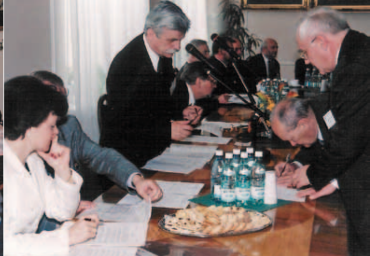
Podpisanie aktu notarialnego utworzenia FRP (7 czerwca 2001)