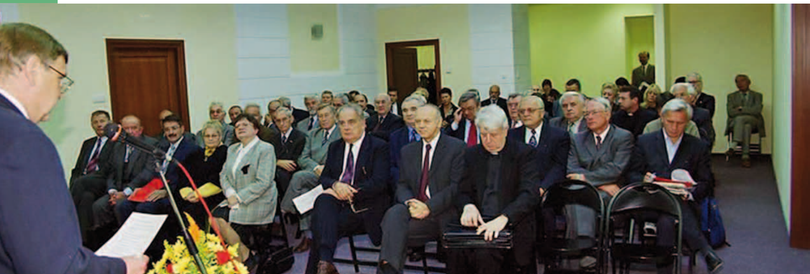
Zjazd rektorów-założycieli FRP i ISW (26 września 2003 r.)