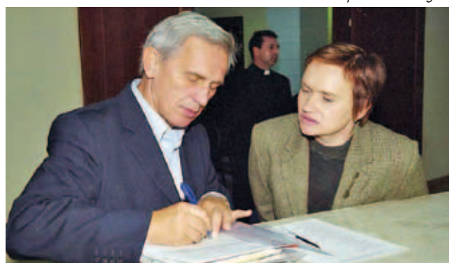
Zjazd rektorów-założycieli FRP i ISW (26 września 2003 r.) prof. Jan Englert