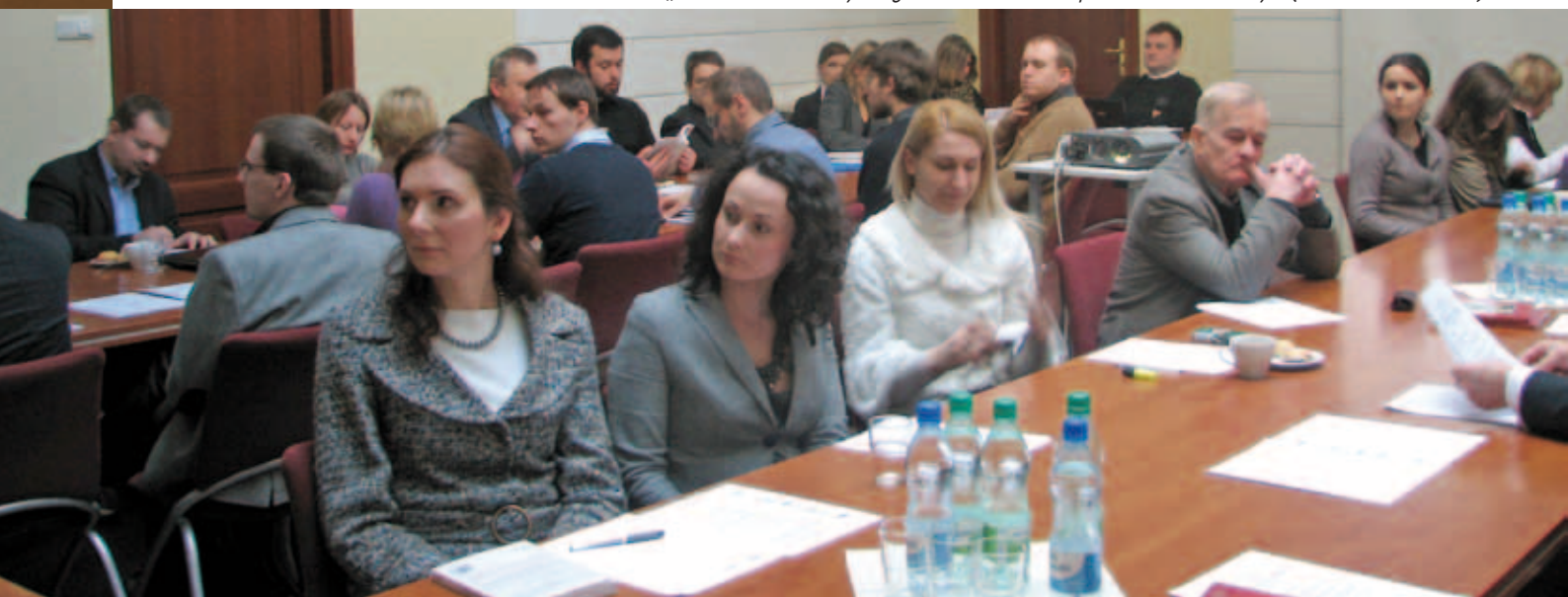
Seminarium „Rola szkolnictwa wyższego w kształtowaniu społeczeństwa wiedzy” (1 czerwca 2009 r.)

We wszystkich Seminariumach w sumie uczestniczyło ok. 100 doktorantów zajmujących się szeroko rozumianą tematyką szkolnictwa wyższego.