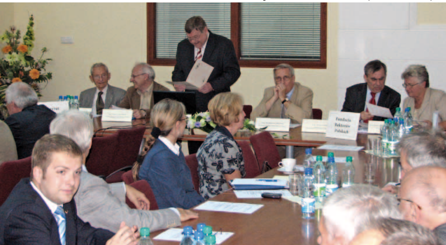
Zgromadzenie Fundatorów FRP i ISW (23 września 2009 r.)