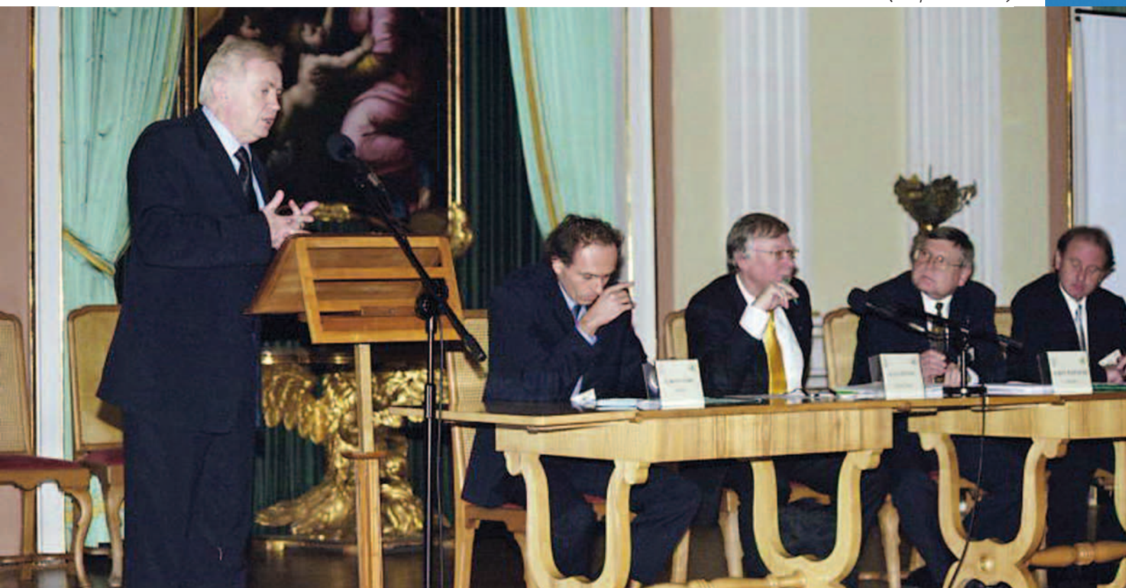
Konferencja pt. New generation of Policy Documents and Laws on Higher Education: Their Thurst in the Context of the Pillars of the Bologna Process (listopad 2004 r.)

FRP była także współorganizatorem międzynarodowej konferencji pn. Demography and Higher Education in Europe. An Institutional Perspective (12-13 Października 2007, Bukareszt, Rumunia. Organizatorem było UNESCO-CEPES), przy współpracy Elias Foundation of the Romanian Academy, OECD oraz Instytutu Społeczeństwa Wiedzy. Dodatkowo, Fundacja przygotowała raport pt. A study on current and prospective impact of demography on Higher Education in Poland .