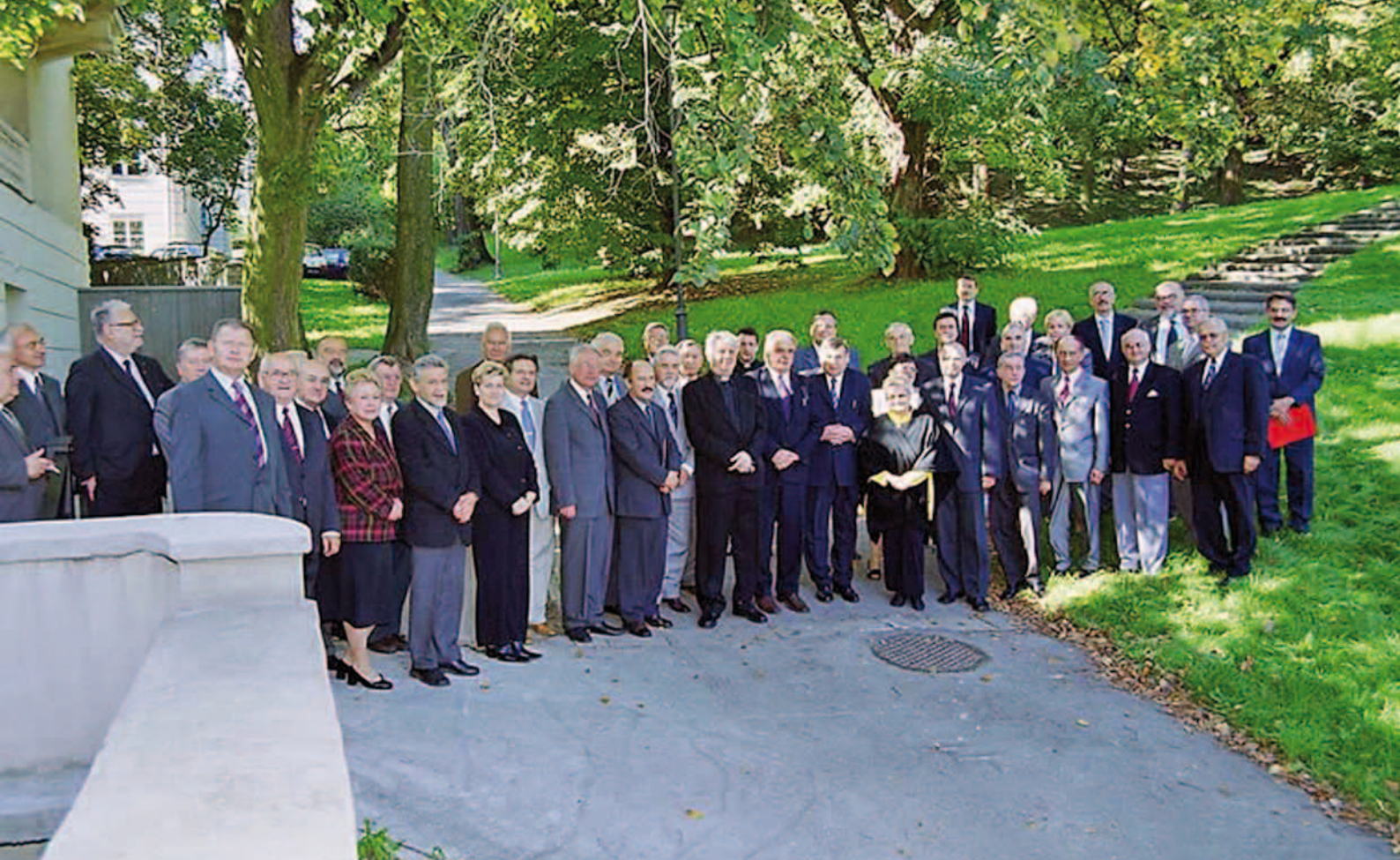
Zjazd rektorów-założycieli FRP i ISW (26 września 2003 r.)