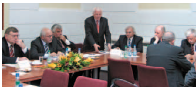
Zgromadzenie Fundatorów FRP i ISW (10 września 2007 r.)

w ramach którego przedstawiono i dyskutowano delegacje ustawowe do statutów uczelni i opcje statutowe wynikające z nowej ustawy Prawo o szkolnictwie wyższym (2005);