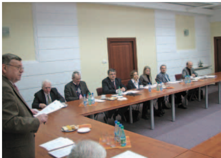
Posiedzenie Komitetu Sterującego (18 lutego 2008 r.)

Przyjęto, że dystrybucja wyników będzie odbywać się w oparciu o media elektroniczne, a także, sygnalnie, przez wydawnictwa tradycyjne (druki). Pozyskiwane dane są opatrywane komentarzem