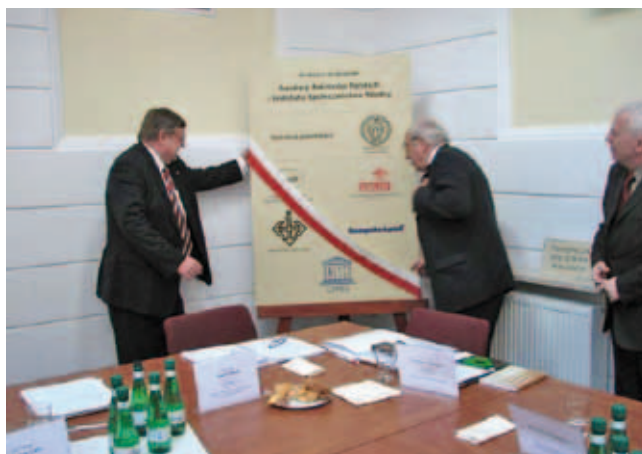
Podpisanie porozumienia strategicznego KRASP-FRP (25 marca 2006 r.)

korzystania z doradztwa ekspertów, w tym m.in. z grona Zespołu Ekspertów Bolońskich. W trzech Forach łącznie uczestniczyło ok. 200 osób (23 stycznia, 16 lutego, 17 marca 2012).