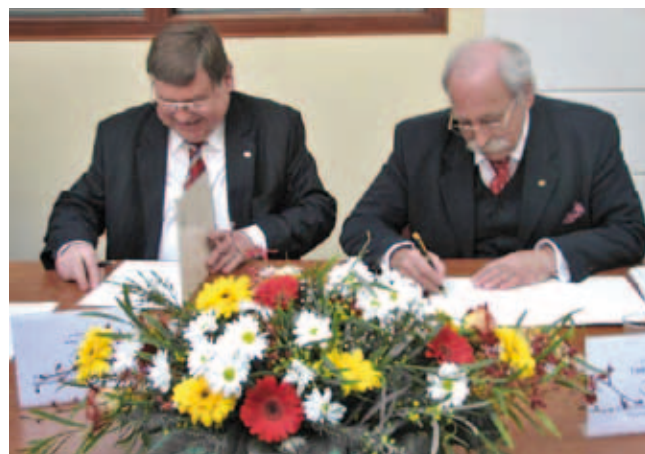
Podpisanie porozumienia strategicznego KRASP-FRP (25 marca 2006 r.)

spraw szkolnictwa wyższego, z którego raport został opublikowany, wspólnie przez FRP oraz KRASP, w książce pod tym samym tytułem.