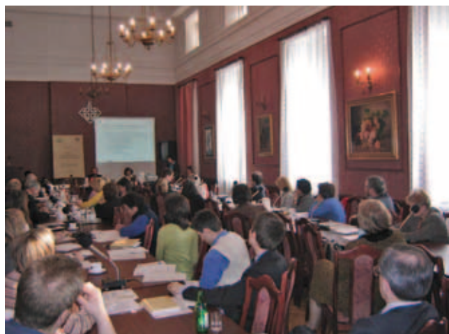
Seminarium pn. Oferta szkolnictwa wyższego a wymagania rynku pracy (12 czerwca 2005 r.)

Fundacja zabrała także głos w podówczas niezwykle aktualnej i ważnej debacie nt. Strategii Lizbońskiej. FRP, przy współpracy Instytutu Społeczeństwa Wiedzy, była organizatorem serii seminariów poświęconych roli uczelni w realizacji tej strategii, przy wsparciu Narodowego Banku Polskiego i Urzędu Komitetu Integracji Europejskiej. Zapis wystąpień i debat, które odbyły się w trakcie seminariów wydano w ramach dwóch tomów pt. Zadania polskich szkół wyższych w realizacji Strategii Lizbońskiej (2004) oraz Zadania polskich szkół wyższych w realizacji nowej Strategii Lizbońskiej (2005).