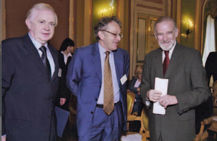
Konferencja pt. New generation of Policy Documents and Laws on Higher Education: Their Thurst in the Context of the Pillars of the Bologna Process (listopad 2004 r.)

przyjęcie i przedstawienie ministrom 40 krajów, odpowiedzialnym za Proces Boloński, rekomendacji dotyczących harmonizacji prawa o szkolnictwie wyższym w Europie.