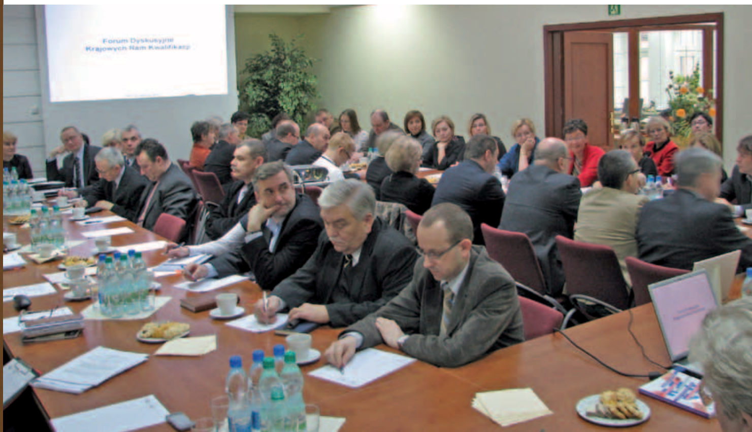
Forum Dyskusyjne Krajowych Ram Kwalifikacji (23 stycznia 2012 r.)